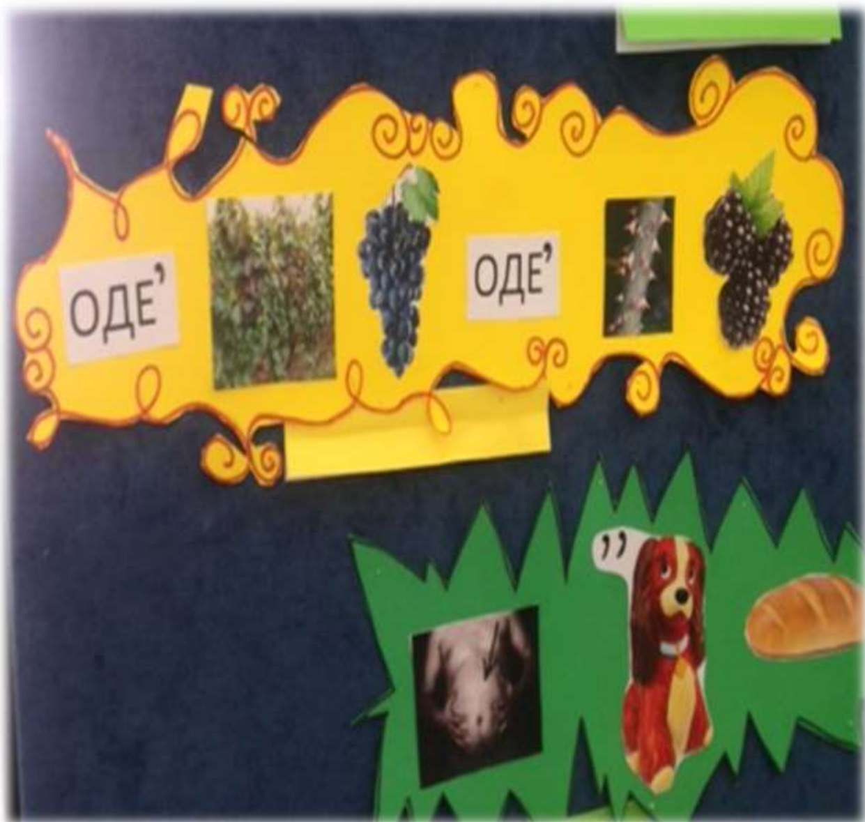
(од лозе грозд, од трна купина) (трбухом за крухом)